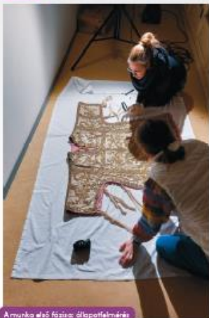
A munka első fázisa: állapotfelmérés.