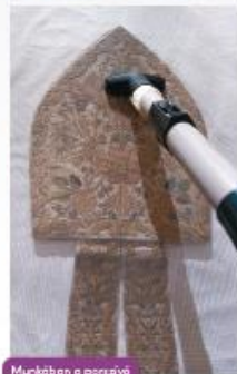
Munkában a porzóvá.