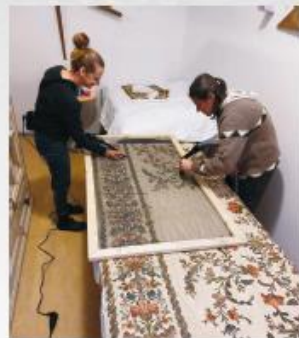
A vörfűt is beájtották.