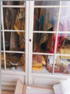
Festiszabvány a munka megkezdése előtt.